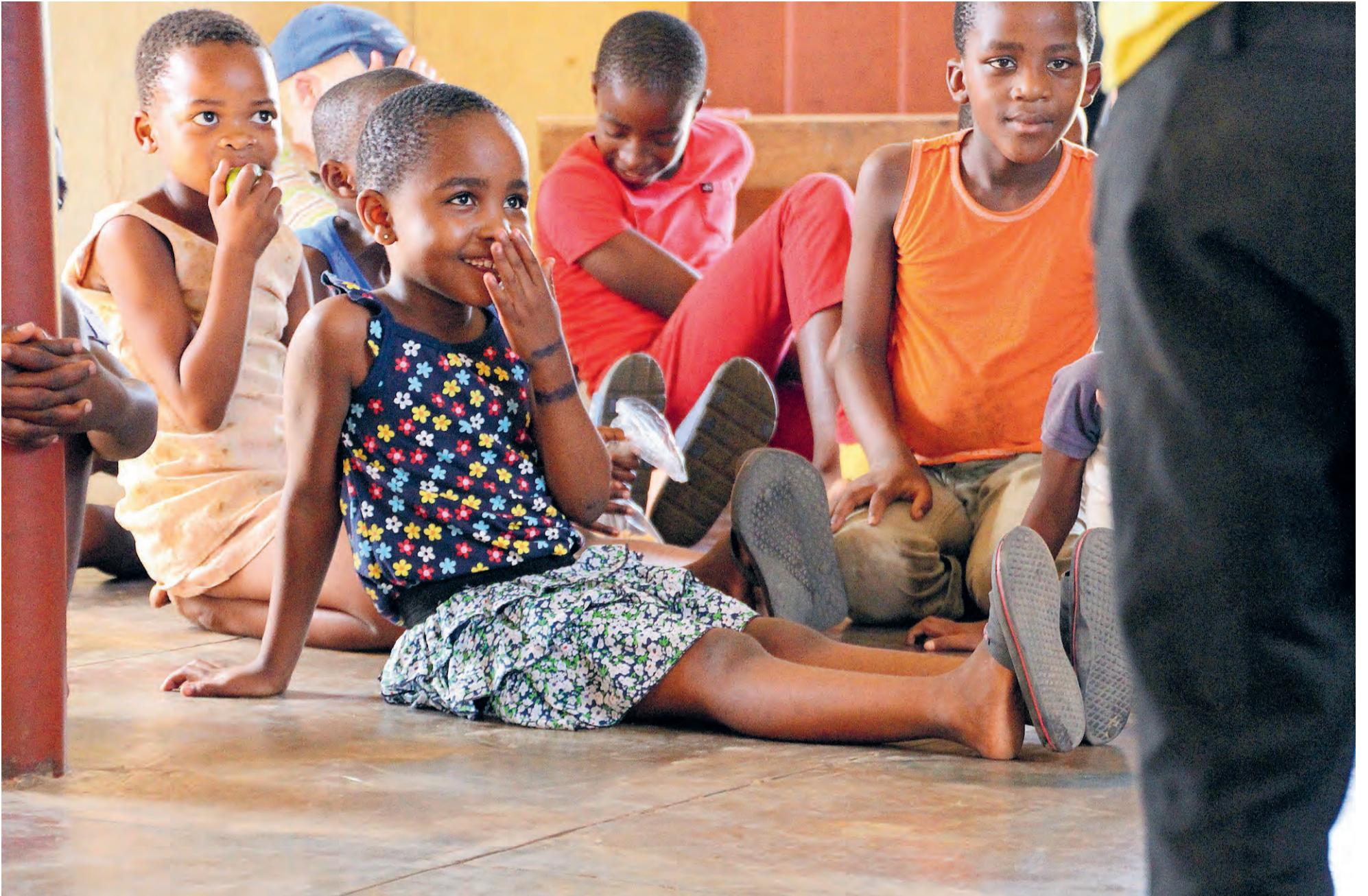
DOOR MIDDEL VAN DRAMA, MUZIEK EN WORKSHOPS WORDEN KINDEREN ONDERWEZEN OVER DE IMPACT VAN HIV/AIDS.