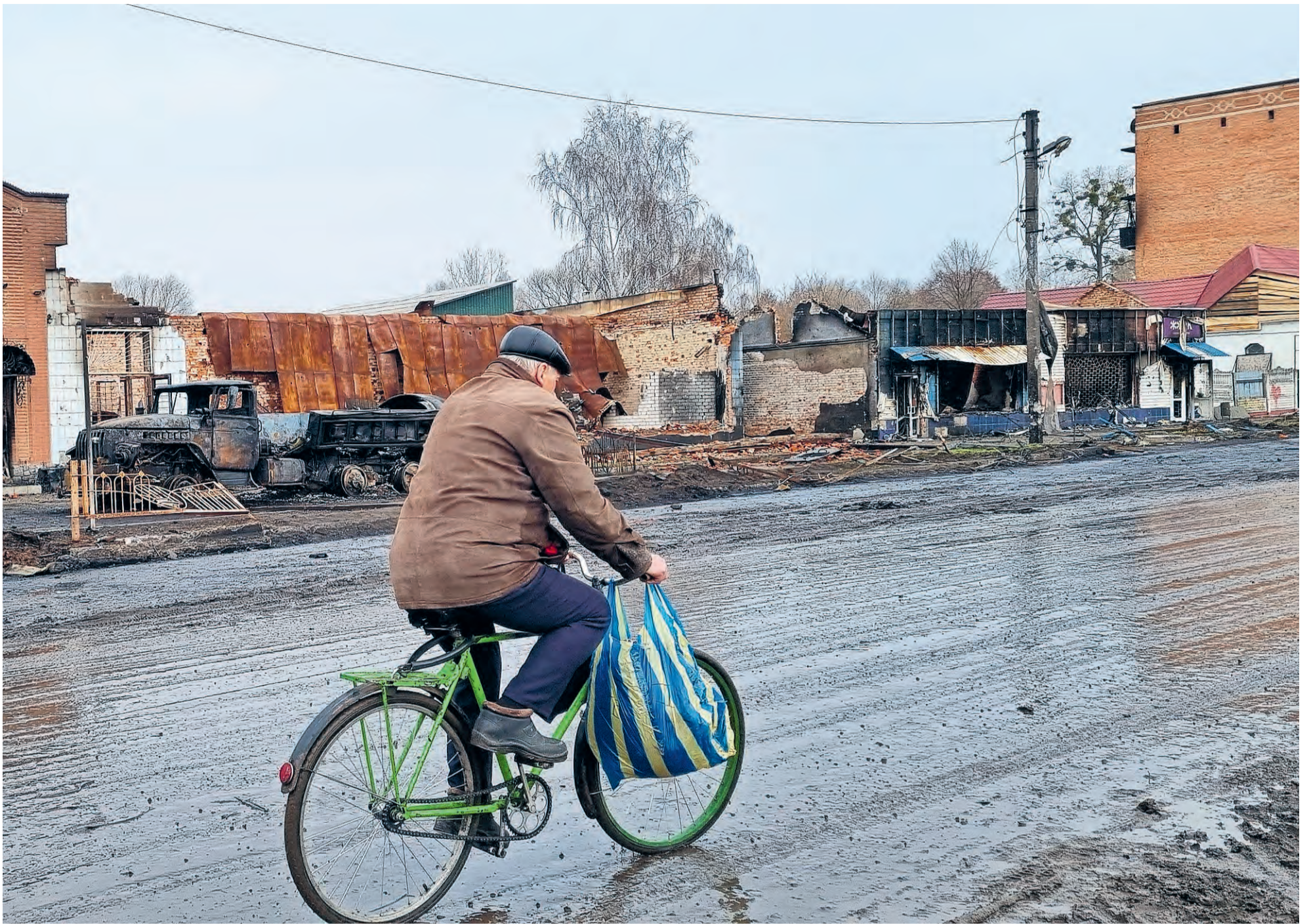
IN MOLDAVIË ZIJN DE LEEFOMSTANDIGHEDEN ERG MOEILIK.