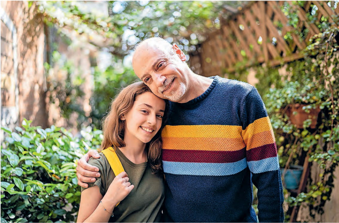
I.V.M. DE VEILIGHEID ZIJN DE PERSONEN OP DE FOTO NIET DIE UIT HET VERHAAL.