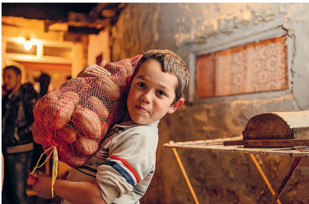
GEBEDSVERHORING: AARDAPPELS VOOR DE ROMA IN SERVIË.

Over een week vieren we Pasen. Jezus is opgestaan. Hij leeft! Die kracht werkt over landsgrenzen, taalbarrières en gevangensmuren heen. Het overwint duisternis, troost mensen, brengt hoop en voorziet – soms heel wonderlijk – in verlatenheid en nood. De kracht van de opstanding in vijf getuigenissen.